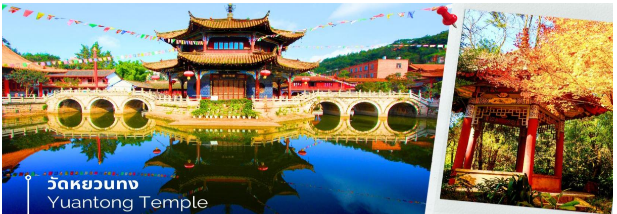
วัดหยวนทง Yuantong Temple

นำท่านชม วัดหยวนทง (Yuantong Temple) วัดแห่งนี้เป็นวัดที่ใหญ่และเก่าแก่ที่สุดในเมืองคุนหมิง สร้างมาตั้งแต่สมัยราชวงศ์ถัง มีอายุยาวนานประมาณ 1,200 กว่าปี การสร้างวัดแห่งนี้จะแปลกตากว่าวัดอื่นในจีน เพราะปกติแล้วการสร้างวัดของจีนส่วนมากจะต้องสร้างอยู่บนภูเขา แต่วัดหยวนทงสร้างวัดต่ำกว่าภูเขา โดยวิหารจะอยู่ต่ำที่สุด เนื่องจากวัดแห่งนี้ไม่ได้สร้างขึ้นเพื่อเป็นวัดโดยตรง แต่เคยเป็นศาลเจ้าแม่กวนอิมมาก่อน