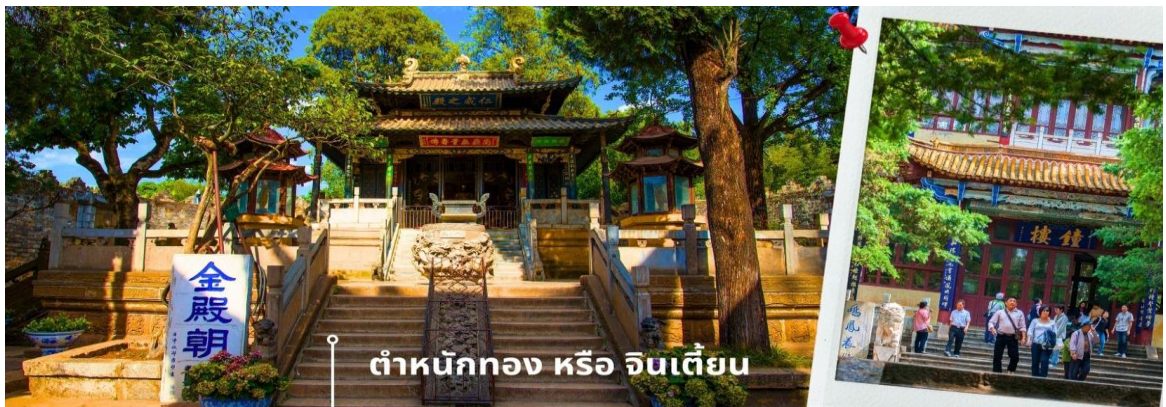
ดำหนักทอง หรือ จินเตี้ยน

นำท่านเยี่ยมชม ดำหนักทอง หรือ จินเตี้ยน (The Golden Temple Park | Jindian park) ( ไม่รวมค่ารถแบดเตอร์ 10 หยวน/ท่าน ) โบราณสถานสำคัญของมณฑลยูนนาน ที่ได้รับการปกป้องดูแลโดยรัฐบาลจีน ตั้งอยู่บริเวณเชิงเขาหมิงเฟิง ล้อมรอบด้วยแนวกำแพงและหอคอยเหมือนเป็นป้อมปราการ ดำหนักทองถูกเรียกตามลักษณะอาคารที่มีสีทองอร่าม จากทองเหลืองในส่วนของผนังและหลังคา รวมกว่า 200 ตัน โดยถือเป็นสิ่งปลูกสร้างสัมฤทธิ์ที่ใหญ่ที่สุดของจีน ภายในมีรูปปั้นทองโดยมีเงินฉู่ (เสวียนฉู่) เทพเจ้าลัทธิเต๋าเป็นองค์ประธาน