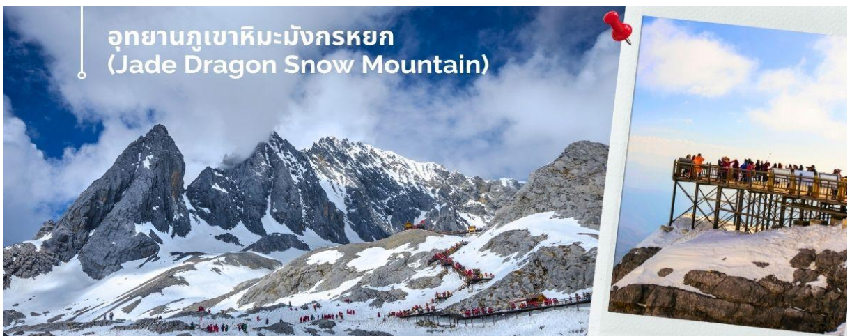
อุทยานภูเขาหิมะมังกรหยก (Jade Dragon Snow Mountain)

(หมายเหตุ : กรณีที่มีการประกาศปิดให้บริการกระแสไฟฟ้า อันเนื่องมาจากเหตุผลด้านสภาพอากาศไม่เอื้ออำนวย, การปิดซ่อมบำรุง, หรือเหตุผลใดๆ บริษัทผู้จัดขอสงวนสิทธิ์ในการปรับเปลี่ยนโปรแกรมท่องเที่ยวอื่นทดแทน หรือในกรณีที่กระแสเข้าใหญ่ปิด ทางบริษัทผู้จัดจะเปลี่ยนมาขึ้นกระแสเข้าเล็กจนชั้นผิงแทน โดยไม่ต้องแจ้งให้ทราบล่วงหน้า)