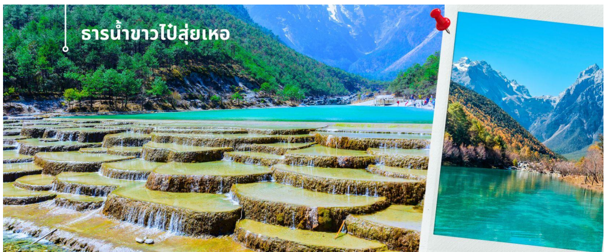
ธารน้ำขาวไปสู่เหอ

ท่านชม ธารน้ำขาวไปสู่เหอ หรือ ทะเลสาบไปสู่เหอ (รวมค่าบริการรถแบดเดอรี) ทะเลสาบสีเทอร์ควอยซ์ตัดกับวิวต้นไม้ ท่ามกลางขุนเขาแห่งหุบเขาพระจันทร์สีน้ำเงิน จากของภูเขาหิมะมังกรหยก มีน้ำตกหินปูนชั้นบันไดขนาดเล็กลดหลั่นลงมาอย่างสวยงาม น้ำที่ไหลผ่านหุบเขานี้คือน้ำที่ละลายจากหิมะบนยอดเขาหิมะมังกรหยก เนื่องจากจุดนี้มีทิวทัศน์ที่สวยงามมีฉากหลังคือภูเขาหิมะมังกรหยกมีน้ำตกและแม่น้ำกึ่งทะเลสาบจึงเป็นที่นิยมของนักท่องเที่ยวช่างภาพและคู่รักเป็นอย่างมาก