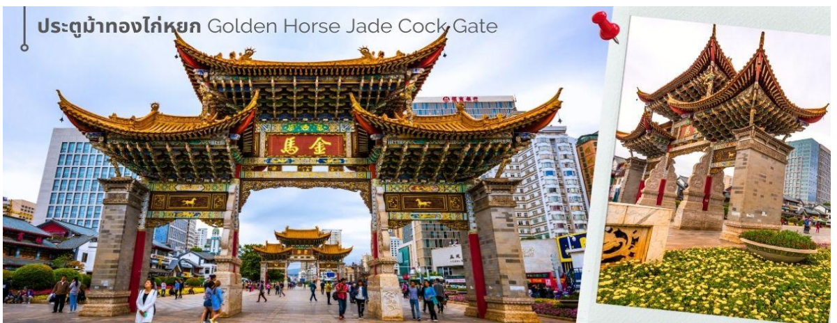
ประตูม้าทองไก่อหยก Golden Horse Jade Cock Gate

ชม ชมประตูม้าทอง และ ชมประตูไก่อหยก ซึ่งภาษาจีนเรียกว่าจินหมา และปี้จี้ จิงเอาค้ายอ จินปี้ มาชานานนามถนนแห่งนี้ ชมม้าทองและไก่อหยก มีอายุร่วม 400 ปี สร้างขึ้นในสมัยราชวงศ์หมิง ในถนนย่านการค้าแห่งนี้ เป็นแหล่งเสื้อผ้าแบรนด์เนมทั้งของจีนและต่างประเทศ รวมทั้งเครื่องประดับ อัญมณี ร้านเครื่องดื่ม และร้านขายของที่ระลึกมากมาย