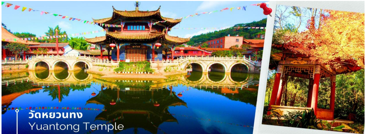
วัดหยวนตง Yuantong Temple