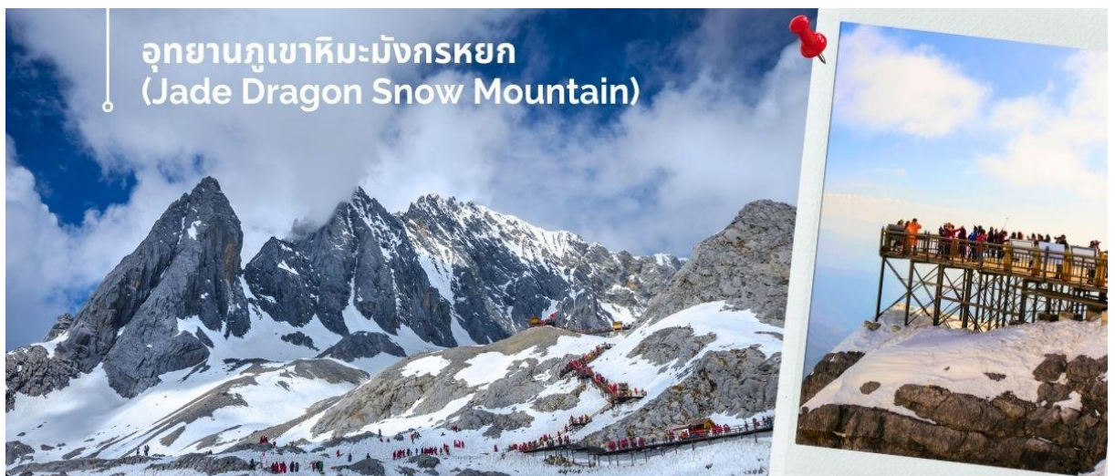
อุทยานภูเขาหิมะมังกรหยก (Jade Dragon Snow Mountain)

(หมายเหตุ : กรณีที่มีการประกาศปิดให้บริการกระเช้าไฟฟ้า อันเนื่องมาจากเหตุผลด้านสภาพอากาศไม่เอื้ออำนวย, การปิดซ่อมบำรุง, หรือเหตุผลใดๆ บริษัทผู้จัดของสงวนสิทธิ์ในการปรับเปลี่ยนโปรแกรมท่องเที่ยวอื่นทดแทน หรือในกรณีที่กระเช้าใหญ่ปิด ทางบริษัทผู้จัดจะเปลี่ยนมาขึ้นกระเช้าเล็กยูนชันผิงแทน โดยไม่ต้องแจ้งให้ทราบล่วงหน้า)