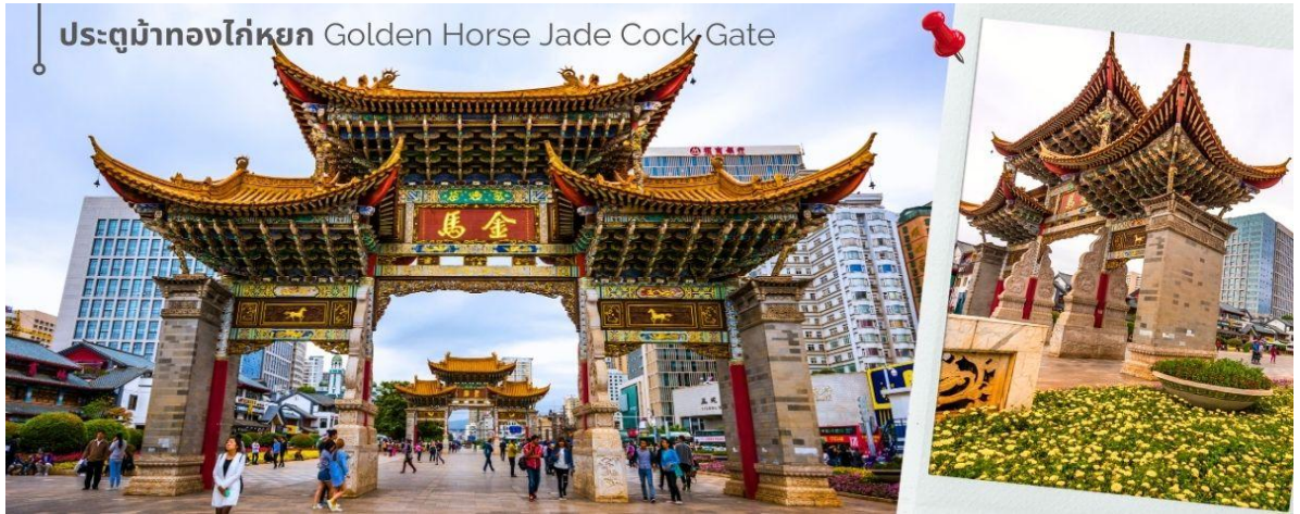
ประตูม้าทองไค่หยุก Golden Horse Jade Cock Gate