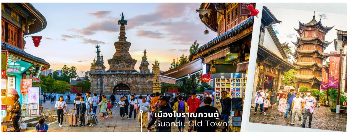
เมืองโบราณกวนตุ๋ Guandu Old Town

นำท่านชมบรรยากาศ เมืองโบราณกวนตุ๋ (Guandu Old Town) เป็นหนึ่งในต้นกำเนิดของวัฒนธรรมยูนนาน และยังถือเป็นหนึ่งในภูมิทัศน์ทางประวัติศาสตร์และวัฒนธรรม ที่สำคัญของเมืองคุนหมิง เมืองโบราณแห่งนี้ยังคงเคยเป็นศูนย์กลางทางการค้าและคมนาคมที่สำคัญ ในอดีตเคยเป็นหมู่บ้านชาวประมงในสมัยราชวงศ์ถัง เมืองกวนตุ๋ยังเป็นเมืองแรกๆ ที่ศาสนาพุทธในทิเบตได้เริ่มเผยแผ่เข้ามาในดินแดนยูนนาน