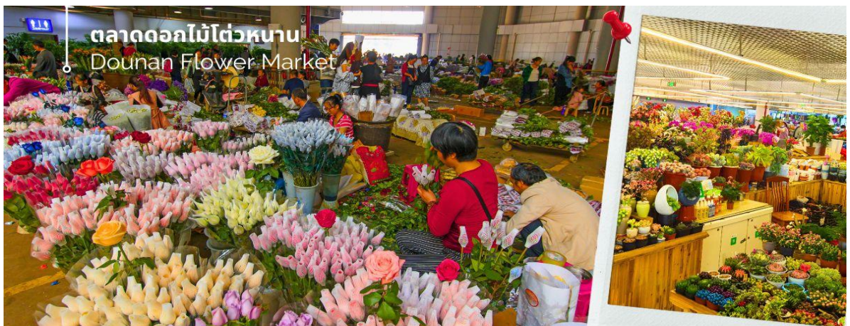
ตลาดดอกไม้ไต้หวัน Dounan Flower Market

นำท่านชม ตลาดดอกไม้ไต้หวัน เป็นตลาดค้าส่งดอกไม้ที่ใหญ่ที่สุดของจีน เปิดทำการค้าตลอด 24 ชั่วโมงไม่มีช่วงเวลาปิดทำการ โดยในปี 2566 ตลาดดอกไม้ไต้หวันมีปริมาณการซื้อขายดอกไม้โดยเฉลี่ยรวม 13,540 ล้านบาท คิดเป็นมูลค่า 13,570 ล้านบาท ถือเป็นตลาดค้าปลีก-ส่ง ผลิตผลทางการเกษตรที่ใหญ่ที่สุดในประเทศจีนอีกด้วย