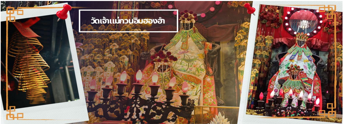
วัดเจ้าแม่กวนอิมรองอำ

e-mail: tour.aaj@gmail.com, Website: www.allabout-journey.com