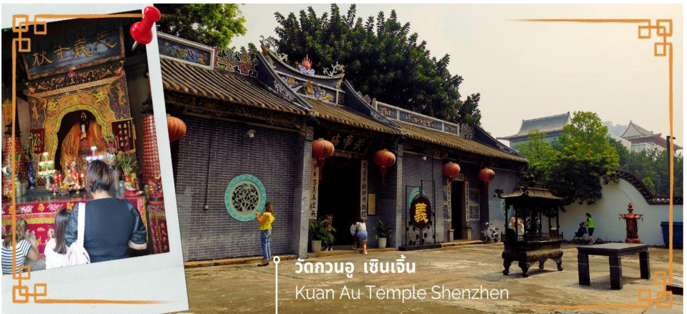
วัดกวนอู เซินเจิ้น Kuan Au Temple Shenzhen

จากนั้นนำท่านเดินทางสู่ วัดกวนอู ไหว้เทพเจ้ากวนอู สัญลักษณ์ของความซื่อสัตย์ ความกตัญญูรู้คุณ ความจงรักภักดี ความกล้าหาญ โขดคลาก และบารมี ท่านเปรียบเสมือนตัวแทนของความเข้มแข็งเด็ดเดี่ยวของอาจไม่ครั้นคร้ามต่อศัตรู ท่านเป็นคนจิตใจมุ่งมั่นคงตั้งขุนเขา มีสติปัญญาเฉลียวฉลาด และไม่เคยประมาทการบูชาขอพรท่านก็หมายถึงขอให้ท่านช่วยอดช่องว่างไม่ให้เพลิงพล้ำแก่ฝ่ายตรงข้าม และให้เกิดความสมบูรณด้วยคนข้างเคียงที่ซื่อสัตย์ หรือบริวารที่ไว้วางใจได้นั่นเองตั้งนั้นประชาชนคนจีนจึงนิยมบูชา และกราบไหว้เพื่อความเป็นสิริมงคลต่อตนเอง และครอบครัวในทุกๆ ด้าน