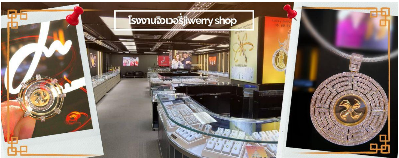
โรงงานจิวเวอรี่jewery shop

จากนั้นนำท่านชม โรงงานจิวเวอรี่ ซึ่งเป็นโรงงานที่มีชื่อเสียงที่สุดของฮ่องกงในเรื่องการออกแบบเครื่องประดับ อาทิเช่น จี้ และแหวนกั้งหัน ที่สวยงามโดดเด่นไม่เหมือนใคร ซึ่งถือกำเนิดขึ้นที่นี่และมีชื่อเสียงที่สุดใช้เป็นเครื่องประดับติดตัว และเสริมดวงชะตา สินค้าทุกชิ้นมีเอกสารรับประกันคุณภาพ เปลี่ยน ซ่อม ใต้ตลอดอายุการใช้งาน หากเกิดการชำรุดจากสินค้าไม่ใช่อุบัติเหตุ