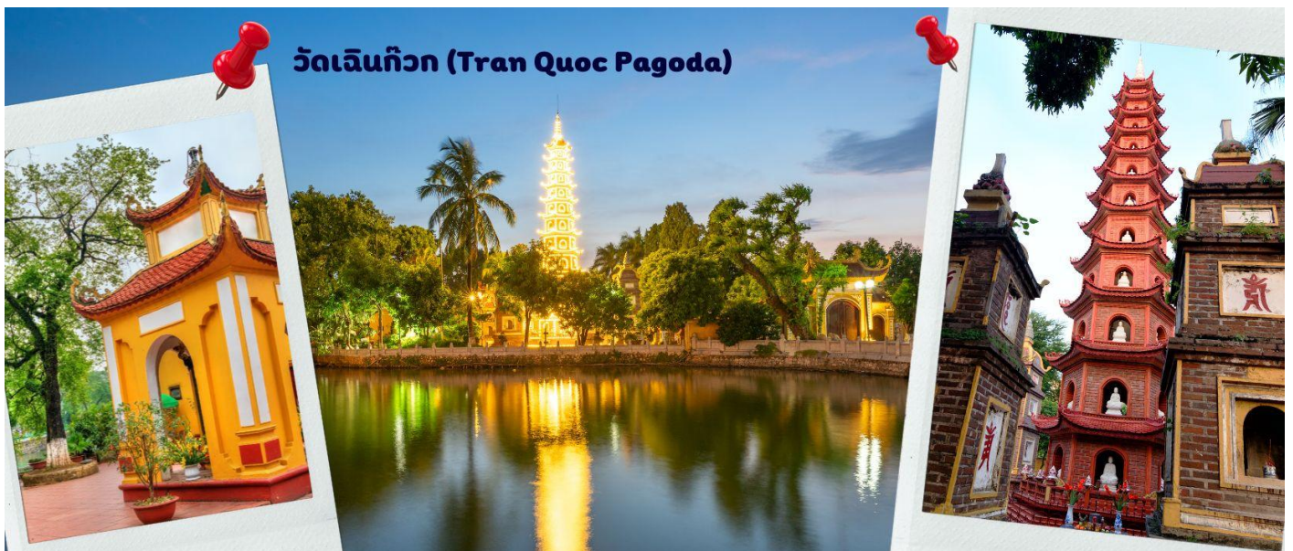
วัดเจินก๊วก (Tran Quoc Pagoda)

จากนั้นนำท่านไป วัดเจินก๊วก (Tran Quoc Pagoda) เป็นวัดที่อยู่ใจกลางเมืองของเวียดนาม ใกล้ชิดกับทะเลสาบตะวันตกของเมืองसानอย สร้างด้วยสถาปัตยกรรมจีนโบราณ มีความร่มรื่น และบรรยากาศดี จึงเป็นที่นิยมของนักท่องเที่ยวทั้งที่ชื่นชมความงามและมีศรัทธาในพระพุทธศาสนา จากภาพมุมสูงของสถานที่ตั้ง ที่นี่เหมือนตั้งอยู่บนเกาะที่ยื่นลงไปทะเลสาบ แต่มีเส้นทางคมนาคมเข้าถึงที่สิ่งปลูกสร้างมีการวางผังเป็นอย่างดี ใช้สีสันทึบกลมกลืนในโทนสีเหลือง น้ำตาล ตัดกับสีเขียวของต้นไม้ใหญ่ที่โอบล้อมอยู่ ในมุมถ่ายภาพจากอีกฝั่งหนึ่ง จะเห็นสิ่งปลูกสร้างสไตล์จีน และเจดีย์หลายชั้นโดดเด่น มีภาพที่สะท้อนลงสู่ผืนน้ำ เป็นภูมิทัศน์ที่งดงามทั้งยามกลางวันและยามค่ำคืนที่มีการเปิดไฟส่องสว่าง