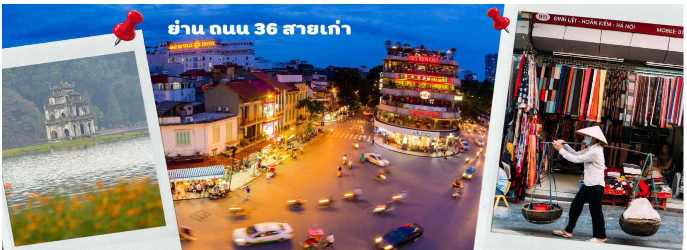
ย่าน ถนน 36 สายเก่า

จากนั้นให้ท่านได้ อิสระช้อปปิ้ง ถนนสาย 36 street แหล่งช้อปปิ้งของฮานอย มีต้นไม้ปกคลุมสอง ฝั่งถนน สาเหตุที่ชื่อถนน 36 มาจาก 36 อาชีพที่ทำการค้าขายบนถนนแห่งนี้ ตั้งแต่อดีตอย่างงานด้าน หัตถกรรมสอดคล้องกับชื่อถนนแต่ละเส้น ในอดีตอย่าง เครื่องเงิน ผ้าไหม บนถนนแห่งนี้ แต่ปัจจุบัน มากกว่า 36 ไปแล้ว ที่นี่จะเป็นแหล่ง Shopping มีสินค้าเกือบทุกชนิด ร้านขายชุดกีฬา มีทุกแบรนด์ เพราะที่นี่เป็นแหล่งผลิตให้หลาย ๆ แบรนด์