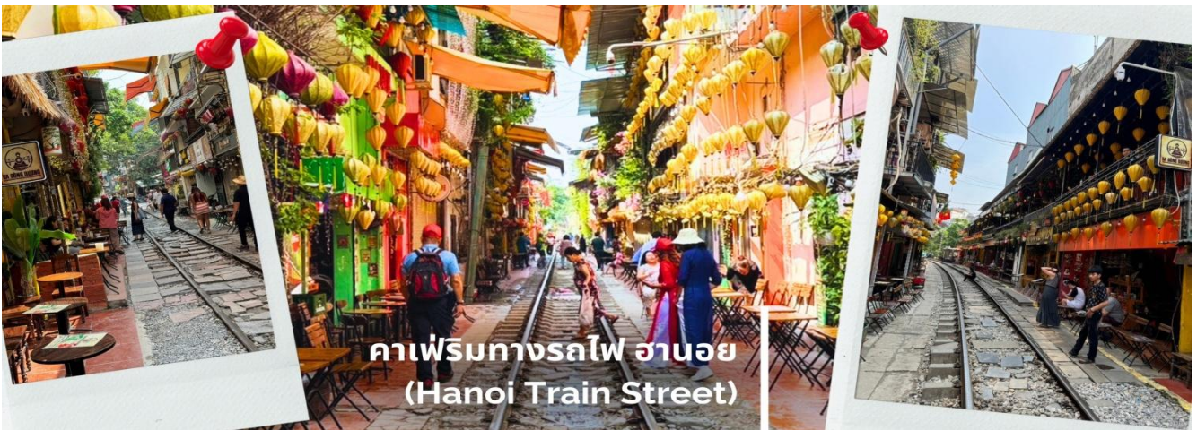
คาเฟ่ริมทางรถไฟ ฮานอย (Hanoi Train Street)

จากนั้นนำท่านเข้าสู่ คาเฟ่ริมทางรถไฟ (HANOI TRAIN STREET) เป็นหนึ่งในสถานที่ท่องเที่ยว ที่มีชื่อเสียงและน่าพจญภัยในฮานอย ตั้งอยู่ในตรอกแคบๆ ย่าน Old Quarter ของฮานอย ซึ่งล้อมรอบด้วย บ้านทรงสูงแคบที่อยู่ติดกันแน่นๆ จุดเด่น คือ สามารถนั่งมองรถไฟวิ่งผ่านอย่างใกล้ชิด ได้วันละหลาย รอบ ที่ถ่ายรูปออกมาสวย ถนนสายเล็กๆ สองข้างทางจะเป็นบ้านผู้คน ที่อาศัยอยู่จริง และมีคาเฟ่น่ารัก เยอะมาก (ไม่รวมค่าอาหารและเครื่องดื่มทุกชนิด)