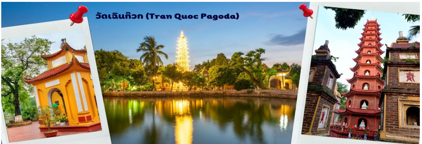
วัดเจินก๊วก (Tran Quoc Pagoda)

จากนั้นนำท่านไป วัดเจินก๊วก (Tran Quoc Pagoda) เป็นวัดที่อยู่ใจกลางเมืองของเวียดนาม ใกล้ชิดกับทะเลสาบตะวันตกของเมืองฮานอย สร้างด้วยสถาปัตยกรรมจีนโบราณ มีความร่มรื่น และบรรยากาศดี จึงเป็นที่นิยมของนักท่องเที่ยวทั้งที่ชื่นชมความงามและมีศรัทธาในพระพุทธศาสนา จากภาพมุมสูงของสถานที่ตั้ง ที่นี่เหมือนตั้งอยู่บนเกาะที่ยื่นลงไปทะเลสาบ แต่มีเส้นทางคมนาคมเข้าถึงที่ สิ่งปลูกสร้างมีการวางผังเป็นอย่างดี ไข่มุกสีเงินที่กลมกลืนในโทนสีเหลือง น้ำตาล ตัดกับสีเขียวของต้นไม้ใหญ่ที่โอบล้อมอยู่ ในมุมถ่ายภาพจากอีกฝั่งหนึ่ง จะเห็นสิ่งปลูกสร้างสไตล์จีน และเจดีย์หลายชั้นโดดเด่น มีภาพที่สะท้อนลงสู่ผืนน้ำ เป็นภูมิทัศน์ที่งดงามทั้งยามกลางวันและยามค่ำคืนที่มีการเปิดไฟส่องสว่าง