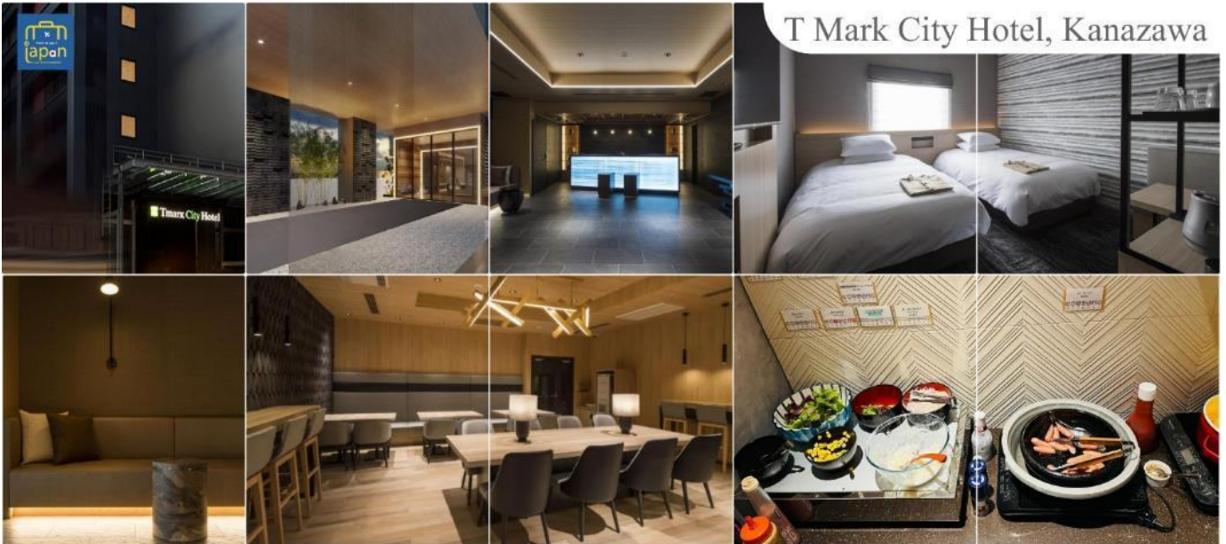
T Mark City Hotel, Kanazawa