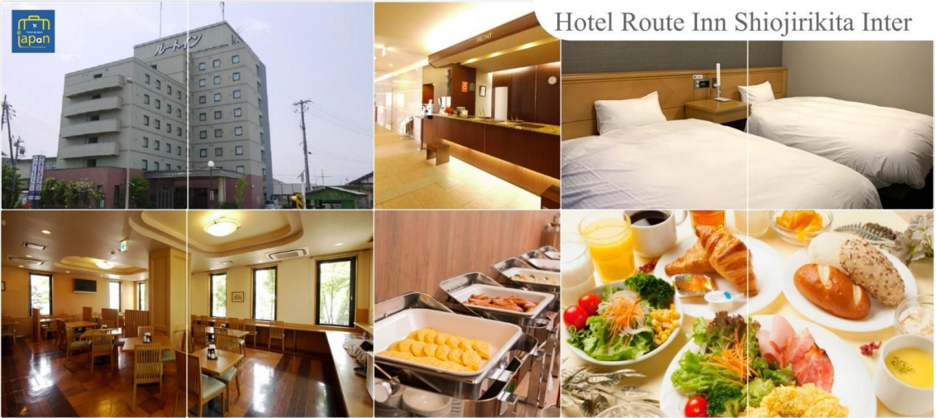
Hotel Route Inn Shiojirikita Inter

e-mail: tour.aaj@gmail.com, Website: www.allabout-journey.com