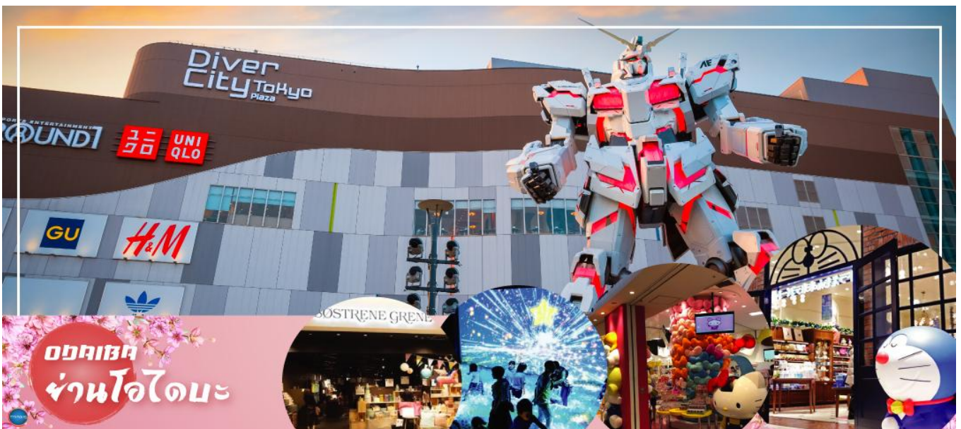
ออบ้าท์ ย่านโอไดบะ

นำท่านสู่ ย่านโอไดบะ (Odaiba) คือเกาะที่สร้างขึ้นไว้เป็นแหล่งช้อปปิ้ง และแหล่งบันเทิงต่างๆ ในอ่าวโตเกียว ได้รับการปรับปรุงให้มีชื่อเสียงและเป็นที่ยอดนิยมในช่วงหลังของปี 1990 นอกจากนี้ยังมีสถาปัตยกรรมที่สวยงามตั้งอยู่มากมายแล้ว แต่ก็ยังคงความเป็นธรรมชาติไว้ด้วยความอุดมสมบูรณ์ของพื้นที่สีเขียว ไดเวอร์ซิตี โตเกียว พลาซ่า (Diver City Tokyo Plaza) เป็นห้างดังอีกห้างหนึ่ง ที่อยู่บนเกาะ โอไดบะ จุดเด่นของห้างนี้ก็คือ หุ่นยนต์กันดั้ม ขนาดเท่าของจริง ซึ่งมีขนาดใหญ่มาก ในบริเวณห้าง อีسرช้อปปิ้งตามอัธยาศัย