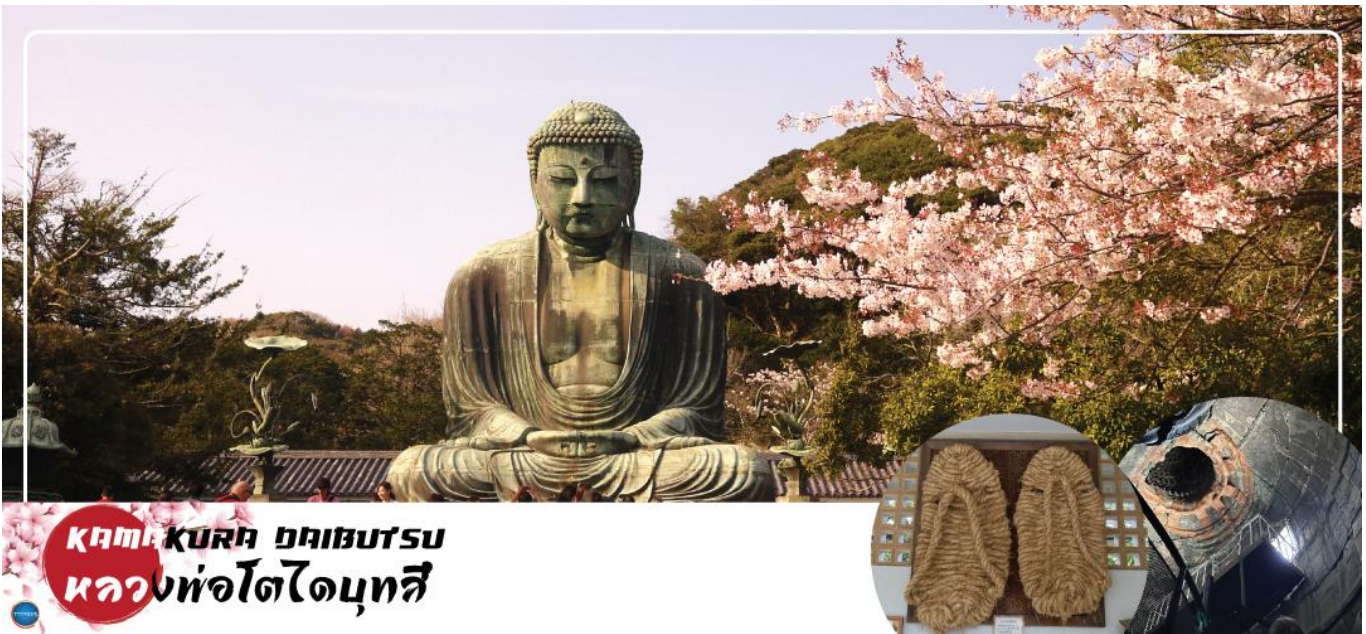
KAMAKURA ภูมิภาค หลวงพ่อดาไดบุทสึ

07.55 น. เดินทางถึง ท่าอากาศยานนานาชาตินาริตะ ประเทศญี่ปุ่น นำท่านผ่านขั้นตอนการตรวจคนเข้าเมือง และศุลกากร เรียบร้อยแล้ว (เวลาที่ญี่ปุ่น เร็วกว่าเมืองไทย 2 ชั่วโมง กรุณาปรับนาฬิกาของท่านเพื่อความสะดวกในการนัดหมายเวลา) ***สำคัญมาก!! ประเทศญี่ปุ่นไม่อนุญาตให้นำอาหารสด จำพวก เนื้อสัตว์ พืช ผัก ผลไม้ เข้าประเทศ หากฝ่าฝืนมีโทษปรับและจับ