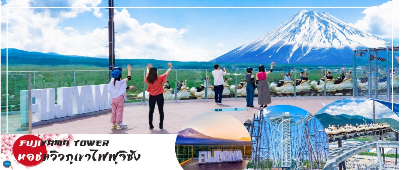
ฟูจิยามา TOWER หอชมวิวภูเขาไฟฟูจิซัง

e-mail: tour.aaj@gmail.com, Website: www.allabout-journey.com