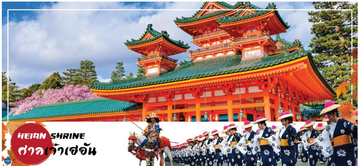
HEIAN SHRINE ศาลเจ้าเฮอัน

วันที่ห้า เมืองนาโกย่า – เมืองเกียวโต – ศาลเจ้าเฮอัน – การเรียนพิธีชงชาญี่ปุ่น – เมืองโอซาก้า – LALAPORT & MITSUI OUTLET PARK OSAKA KADOMA – ช้อปปิ้งชินไซบาชิ