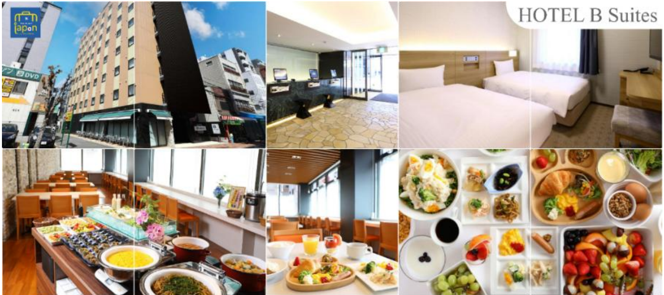
พักที่ HOTEL B SUITES NAMBA, OSAKA หรือเทียบเท่าระดับเดียวกัน