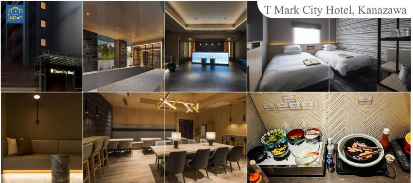
T Mark City Hotel, Kanazawa

e-mail: tour.aaj@gmail.com, Website: www.allabout-journey.com