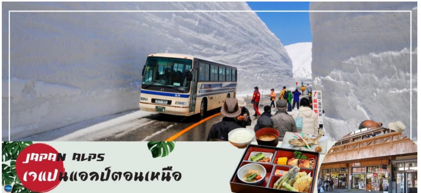
เช้า รับประทานอาหารเช้า ณ ห้องอาหารของโรงแรม (2) (กรณีได้รอบเจแปนแอลป์ช่วงเช้าก่อนห้องอาหารเปิด จะเป็น BOX SET)

วันที่สาม เมืองคานาซาวา – สถานีทาเทยามะ – Japan Alps ถนนสายอัลไพน์ทาเทยามา – กำแพงหิมะ – เชื้อนครุโรเบะ – สถานีโองิซาวะ – เมืองมัตสึโมโตะ