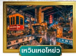
เหวินเหอไห่

เดินทางโดย : สายการบินโล่ออนแอร์ อาหาร : 13 มื้อ โรงแรม : 4 ดาว