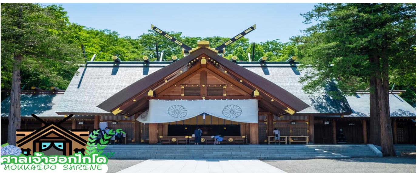
ศาลเจ้าฮอกไกโด HOKKAIDO SHRINE

นำท่านเดินทางสู่ ศาลเจ้าฮอกไกโด (Hokkaido shrine) ศาลเจ้าแห่งนี้ตั้งอยู่ที่ซัปโปโร เป็นศาลเจ้าศาสนาพุทธนิกายชินโตถือเป็นศาลเจ้าที่มีความเก่าแก่แห่งหนึ่งในเกาะฮอกไกโด ถูกสร้างขึ้นในปี ค.ศ. 1871 ในปัจจุบันก็ยังคงมีความเกี่ยวข้องกับวิถีชีวิตของชาวฮอกไกโดอย่างลึกซึ้ง เริ่มตั้งแต่การมาสักการะในวันปีใหม่ การปิดเป้ารังควาญ วันเซ็ดสึนุ พิธีสมรสและอื่น ๆ เป็นต้น ในเขตศาลเจ้าที่มีธรรมชาติอุดมสมบูรณ์ มีกระรอกป่ามาเยี่ยมทักทาย