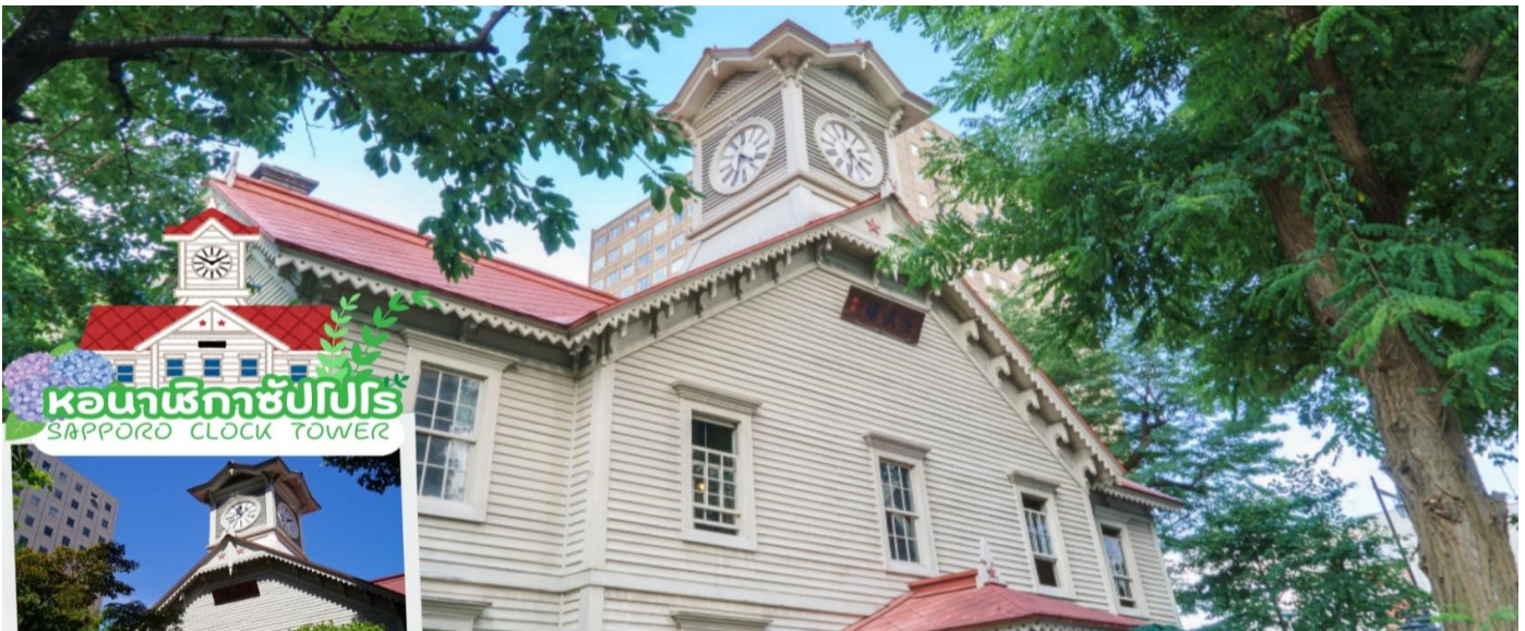
หอนาฬิกาซัปโปโร SAPPORO CLOCK TOWER

e-mail: tour.aaj@gmail.com, Website: www.allabout-journey.com