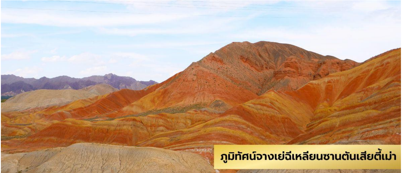
ภูมิทัศน์ของเข็เจีเหลียนซานตันเสียตี้เมา

ล้านปี ผ่านการกัดกร่อนของธรรมชาติ ทำให้เห็นถึงชั้นของแร่ธาตุใต้ดินที่บ้างเป็นริ้วลายหลากสีสันสวยงามมีรูปร่างแปลกตามากมาย