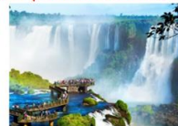
จุดชมวิว Devil's Throat