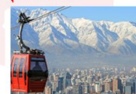
นั่งกระเช้าขึ้นสู่เนินเขาซานต้า ลูเซีย

xx.xx น. ออกเดินทางสู่เมืองปุนตาอาเรเนส เที่ยวบิน... xx.xx น. เดินทางถึงสนามบินปุนตาอาเรเนส ** พักที่ Novotel Las Condes Hotel 4* หรือเทียบเท่า **