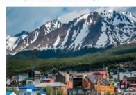
เมืองเอลคาลาฟาเต

** พักที่ Xelena Hotel 4* หรือเทียบเท่า **