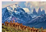
อุทยานแห่งชาติตอร์เรส เดล เพน