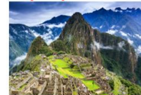
เมืองมาชูปิกชู

** พักที่ Sonesta Cusco Hotel 4* หรือเทียบเท่า **