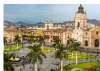
กรุงลิมา

xx.xx น. ออกเดินทางสู่กรุงลิมา เที่ยวบิน... xx.xx น. เดินทางถึงสนามบินลิมา ประเทศเปรู