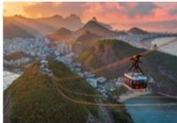
นั่งกระเช้าไฟฟ้าขึ้นสู่ยอดเขาซูการ์โลฟ Sugar Loaf