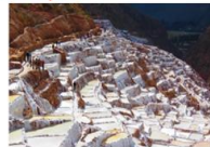
เหมืองเกลือโบราณ