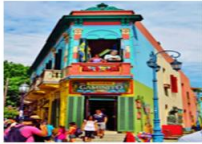
เมืองบัวโนสไอเรส

xx.xx น. ออกเดินทางสู่กรุงบัวโนสไอเรส เที่ยวบิน... xx.xx น. เดินทางถึงสนามบินบัวโนสไอเรส ประเทศอาร์เจนตินา