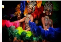
Ginga Tropical Show

** พักที่ Arena Copacabana Hotel 4* หรือเทียบเท่า **