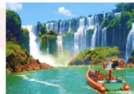
นั่งเรือเจ้ทมาคุคู ชมความสวยงามน้ำตกอิกวาซู

** พักที่ Viale Cataratas Hotel 4* หรือเทียบเท่า **