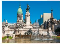
ชมเมืองบัวโนสไอเรส

23.55 น. ออกเดินทางสู่สนามบินอิสตันบูล เที่ยวบิน TK16