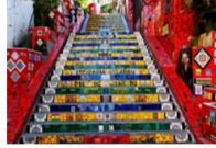
บันไดลาปา

** พักที่ Arena Copacabana Hotel 4* หรือเทียบเท่า **