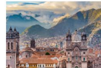
ย่านเมืองเก่าคุชโก้

** พักที่ San Agustin La Recoleta Hotel 4* หรือเทียบเท่า **