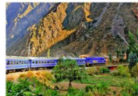
รถไฟขบวนพิเศษ Vistadome