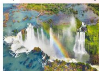
อุทยานแห่งชาติอิกวาซู

xx.xx น. ออกเดินทางสู่อุทยานแห่งชาติอิกวาซู เที่ยวบิน... xx.xx น. เดินทางถึงอุทยานแห่งชาติอิกวาซู