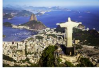
Rio De Janero

03.40 น. เดินทางถึงสนามบินเซาเปาโล ประเทศบราซิล