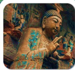
"มรดกโลกผาหินแกะสลักต้าจู้"