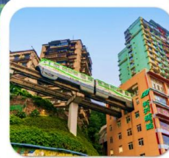
"นั่งรถไฟทะเลสาบ"