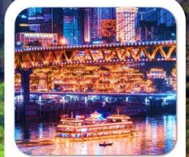
"ล่องเรือชมฉางชานต้าคิน"