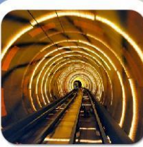
"ลอดอุโมงค์เลเซอร์"

เซี่ยงไฮ้ • ล่องเรือเมืองโบราณจูเจียเจียว • นั่งรถไฟลอดอุโมงค์เลเซอร์ POP MART • วัดจิ้งอัน • อาคารพันต้นไม้ • ตลาดร้อยปีเงินหวงเหมี่ยว อิสระข้อบึงเต็มวัน หรือ จะซื้อตั๋วเที่ยวดิสนีย์แลนด์