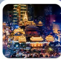
"วัดจิ้งอัน"