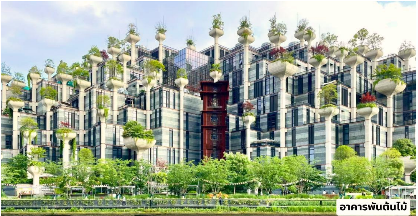
อาคารพันต้นไม้

e-mail: tour.aaj@gmail.com, Website: www.allabout-journey.com