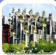
"อาคารพันต้นไม้"