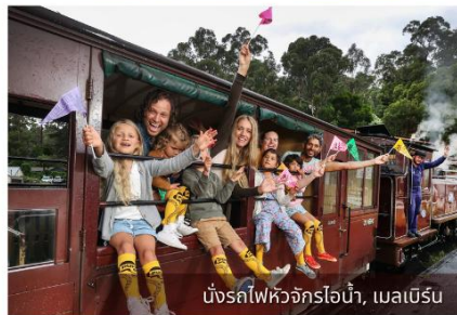
ขบวนรถไฟหัวจักรไอน้ำ, เมลเบิร์น