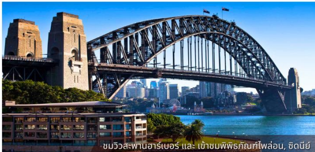
ชมวิวดะพันฮาร์เบอร์ และ เข้าชมพิพิธภัณฑ์ฟลอเรนซ์, ซิดนีย์