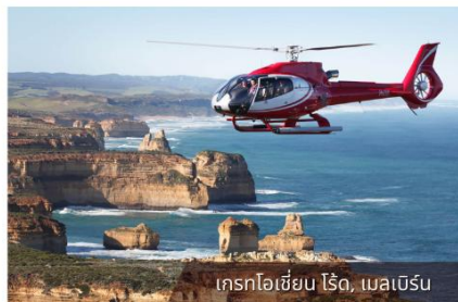
เฮลิคอปเตอร์โรด, เมลเบิร์น