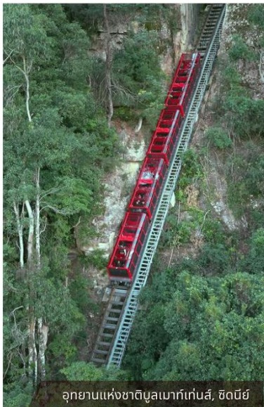
อุทยานแห่งชาติบูแลนมาท์เก็นส์, ซิดนีย์