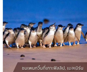
ชมเพนกวินที่เกาะฟิลลิป, เมลเบิร์น