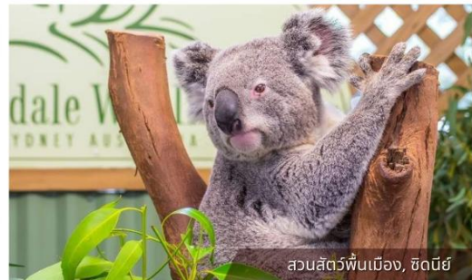
สวนสัตว์พื้นเมือง, ซิดนีย์