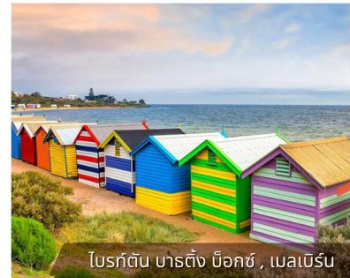
โบสถ์ต้น บาร์ติง บ็อคซ์, เมลเบิร์น