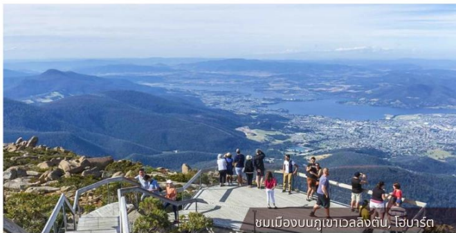
ชมเมืองบนภูเขาเวอลงตัน, โฮบาร์ต