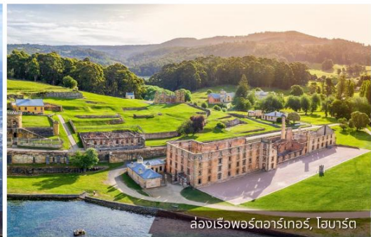
ล่องเรือฟอร์ตอาร์เทอร์, โฮบาร์ต