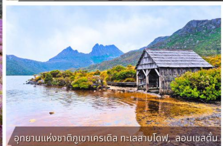
อุทยานแห่งชาติกุเวครีเดิล ทะเลสาบโตฟ, ลอนเชสเตอร์