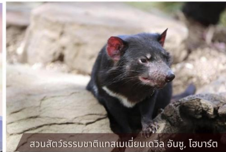
สวนสัตว์ธรรมชาติแทสเมเนีย เดวิล อันชู, โฮบาร์ต