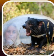
เขบูฟเคยท์มิงทง