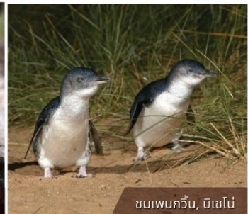
ชมเพนกวิน, บิชอป