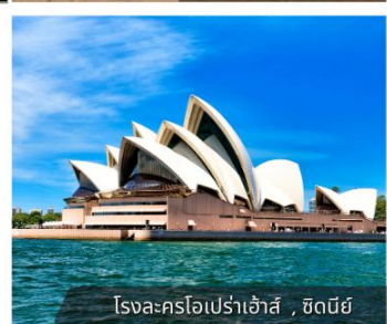
โรงละครโอเปร่าเฮ้าส์, ซิดนีย์