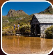
อุทยานแห่งชาติภูเขา เครเดิล