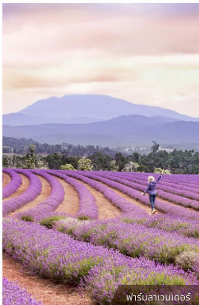
ฟาร์มลาเวนเดอร์