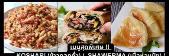
เมนูสุดพิเศษ !! KOSHARI (ข้าวคั่วกั่ว) / SHAWERMA (เนื้อห่อแป้ง) / FITEER BALADI (พิซซ่าอียิปต์)