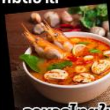
อาหารไทยในไคโร