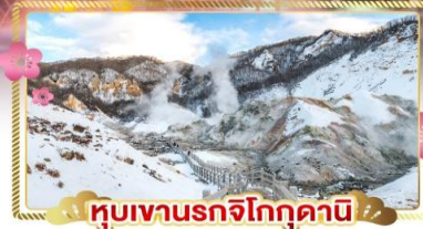
หุบเขานรกจิโกกุคานิ