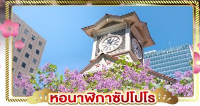
หอนาฬิกาชิปปุโร