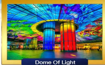
Dome Of Light