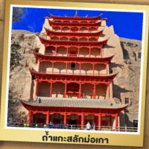
ฉ้าทะสลักม่อเกา