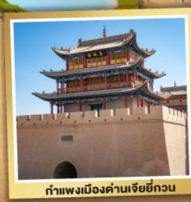
กำแพงเมืองด่านเจียหยี่กวน