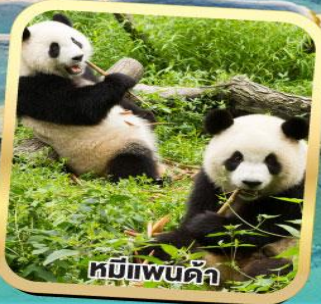
หมีแพนด้า