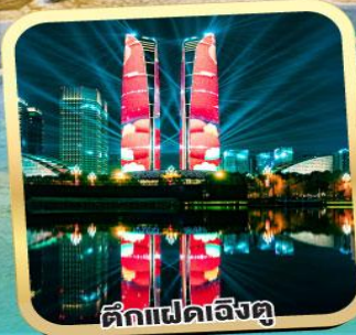
ตึกแฝดเจ็ดจุด