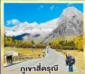
ภูเขาสี่ครุณี