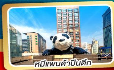
หมีแพนด้าปิ่นดึก