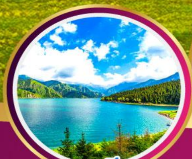
ทะเลสาบเทียนชาน