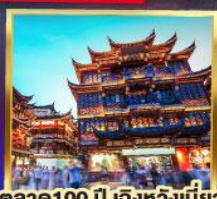
ตลาด 100 ปี เติ้งหวงเหมียว