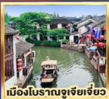
เมืองโบราณซูโจว