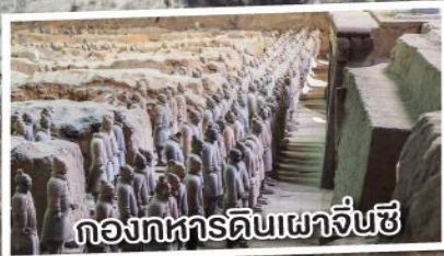
กองทัพดินเผาซีอาน