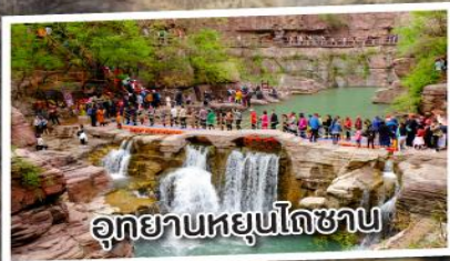
อุทยานหยุนโกซาน