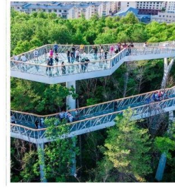
สวนต้นสน