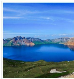
อุทยานฉางไป่ซาน