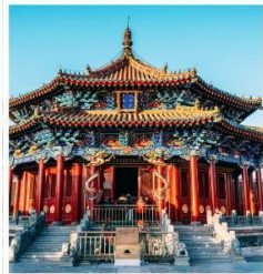
พระราชวังกุ๊กกวง