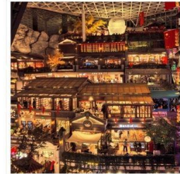
THE HILL CHANGCHUN