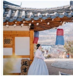
สวนวัฒนธรรม พื้นบ้านเกาหลี