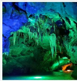
ถ้ำน้ำเป็นซี