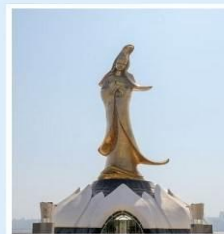
เจ้าแม่กวนอิม ปราสาททองริมทะเล