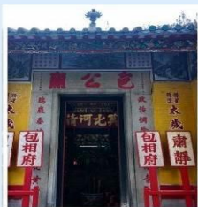
วัดเป่ากง