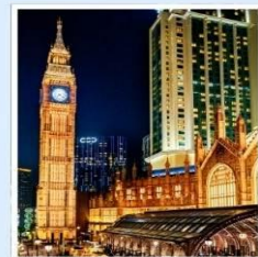
เดอะ ลอนดอนเนอร์