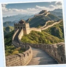
กำแพงเมืองจีน ด่านมู่เถียนยวี่