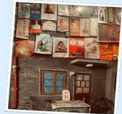
คาเฟ่ย้อนยุคเหอผิง