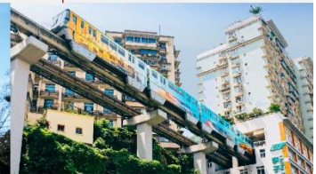
รถไฟฟ้าทะเลสาบ

*ทางบริษัทฯ ขอสงวนสิทธิ์ในการสลับโปรแกรมทัวร์ตามความเหมาะสมขึ้นอยู่กับสถานการณ์หน้างาน โดยคำนึงถึงผลประโยชน์ของลูกค้าเป็นสำคัญ