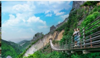
หุบเขารอยแยกอุ๋หลิงซาน