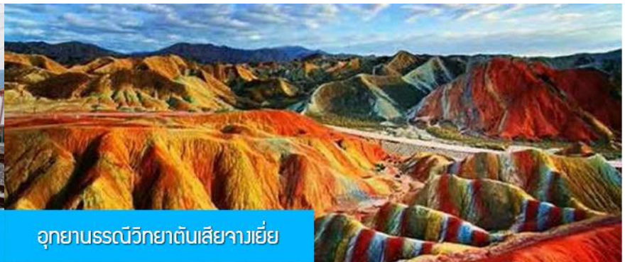
อุทยานธรณีวิทยาต้นเสี้ยวเจียงเยี่ย

วันที่สอง เมืองหลันโจว – นั่งรถไฟความเร็วสูงสู่เมืองฉางเยี่ย – เที่ยวชมอุทยานธรณีวิทยาต้นเสี้ยว(ภูเขาสายรุ้ง)