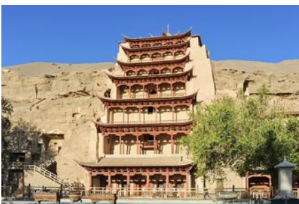
ถ้ำหินม้าเกาคุ

พักที่ REZEN HOTEL ระดับ 4 ดาวห้องถื่นหรือเทียบเท่าในเมือง เจียยวี่กวน