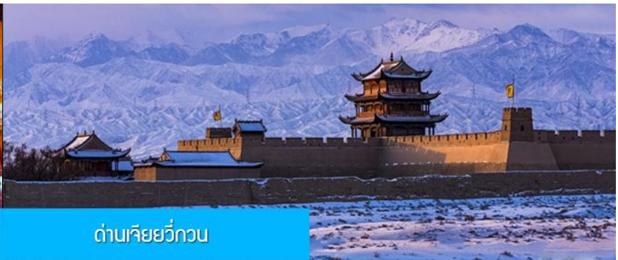
ด่านเจียยวี๊กวน