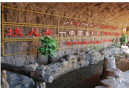
ระบบชลประทานกูหลู่ฟาน

พักที่ HAMPTON BY HILTON HOTEL โรงแรมระดับ 4 ดาวหรือเทียบเท่าในเมืองกูหลู่ฟาน