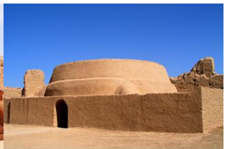
เมืองโบราณกาซางกูเอี