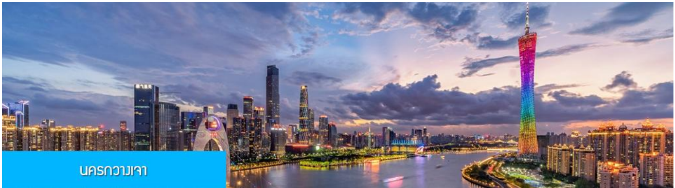
นครกวางเจา