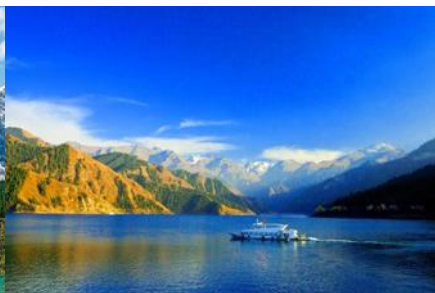
ล่องเรือทะเลสาบเทียนฉิว