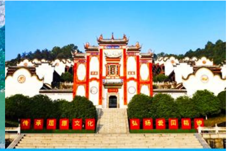
บ้านเกิดกวี ขวี่หยวน