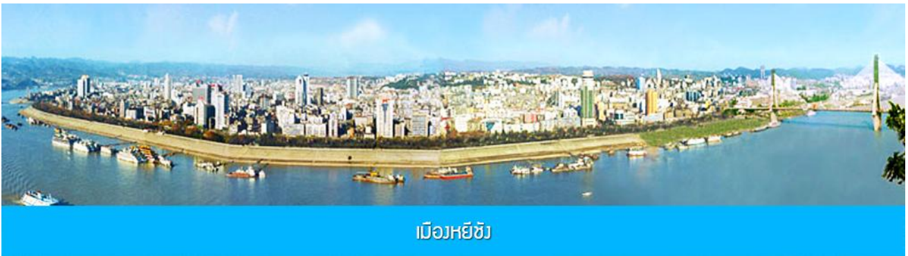
เมืองหยีซาง