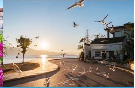
ย่านชายหาดรูป S