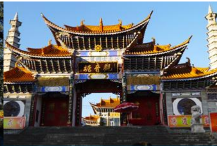
วัดเจ้าแม่กวนอิมแปลงกาย