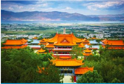
เมืองต้าหลี่

e-mail: tour.aaj@gmail.com, Website: www.allabout-journey.com