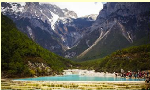
อุทยานไป๋ส่วยเหอ (หุบเขาพระจันทร์สีน้ำเงิน)

-รวมค่ากระเช้าขึ้น ลง ณ สถานีกระเช้า หยุนซานผิงที่สามารถเห็นภูเขาหิมะและทุ่งหญ้าสวิส (อยู่เหนือระดับน้ำทะเล 3,240 เมตร) จุดชมวิว หยุนซานผิง 云杉坪 เป็นทุ่งหญ้าขนาดใหญ่ ด้านทิศตะวันออกของยอดเขาหิมะมังกรหยก ณ จุดนี้นอกจากจะสามารถมองเห็นทัศนียภาพของภูเขาหิมะยังเป็นทุ่งหญ้าสีเขียวที่เสมือนพรมผืนมหึมาที่ปูอยู่บริเวณไหล่เขาของภูเขาหิมะมังกรหยก ได้รับการขนานนามว่าเป็นสวิสแห่งมณฑลยูนนาน