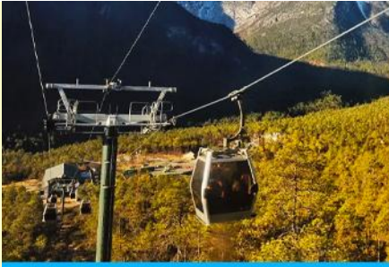
นั่งกระเช้าสกาบี หยุนซานพีว