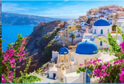
ย่านซานโตรินี่