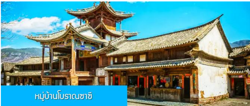
หมู่บ้านโบราณซาซี