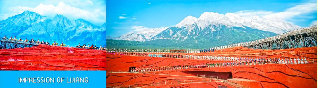
IMPRESSION OF LIJIANG

- ค่าบัตรเข้าชม การแสดงสุดอลังการกลางแจ้ง ชุด IMPRESSION OF LIJIANG ที่กำกับโดย จาง ยี่ โหมว