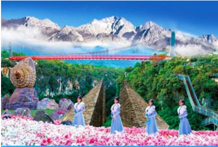
Snow Mountain Canyon Park