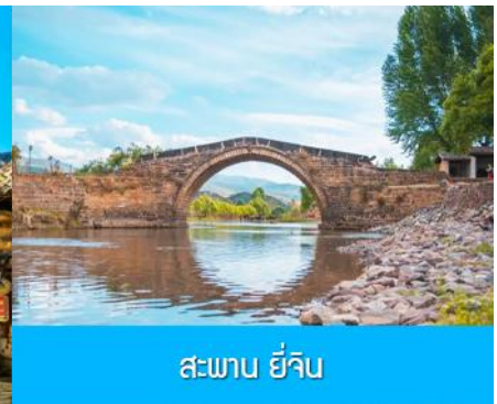
สะพาน ยี่จิ้น

หลังอาหารนำท่านเที่ยวชม หมู่บ้านโบราณซาซี 沙溪古镇 ชุมชนโบราณเก่าแก่ที่มีอายุกว่า 1,200 ปี เป็นชุมทางสำคัญของพ่อค้าเกลือและพ่อค้าชาที่คึกคักในอดีต ชม สะพาน ยี่จิ้น 玉津桥 สะพานโค้งโบราณจีนอายุกว่า 350 ปีที่เป็นสะพานที่คาราวานขนส่งสินค้าจากเหนือลงใต้ หรือจากใต้ขึ้นเหนือต้องใช้เป็นทางผ่าน ซึ่งได้ชื่อว่าเป็นสะพานอันดับหนึ่งในดินแดนต้าหลี่ ชมถนนโบราณที่ปูด้วยหินทรายแดง เข็ม โรงเตี๊ยมและโรงจิวโบราณที่ยังถูกอนุรักษ์ไว้อย่างดี ให้ท่านเลือกชมและถ่ายรูปจากมุมสวยภายในหมู่บ้านโบราณจนครบแก่เวลา นำท่านเดินทางโดยรถบัสสู่เมืองลี่เจียง (ระยะทาง 188 กม.ใช้เวลาเดินทางผ่านถนนซูปเปอร์ไฮเวย์ประมาณ 2 ชั่วโมงครึ่ง)