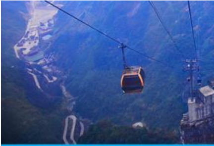
กระเช้าขึ้นเทียนเหมินซาน

e-mail: tour.aaj@gmail.com, Website: www.allabout-journey.com