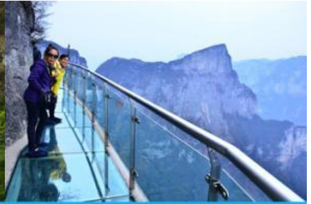
หน้าพาลอยฟ้าทางเดินกระจก

วันที่หก เมืองจางเจี๋ยเจี๋ย – เลือกซื้อโปรแกรมเสริม OPTIONAL TOUR แพ็คเก็จเที่ยวภูเขาเทียนเหมินซาน – ร้านหยก- ร้านใบชา – เดินทางกลับเมืองหยี่ชัง