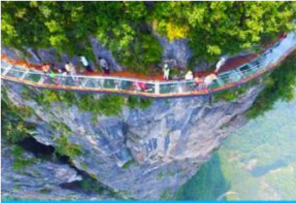
ระเบียงกระจกเลียบนหน้าผาไ้อ้าย

e-mail: tour.aaj@gmail.com, Website: www.allabout-journey.com