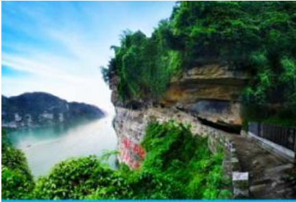
สวนถ้ำสามสหาย

e-mail: tour.aaj@gmail.com, Website: www.allabout-journey.com