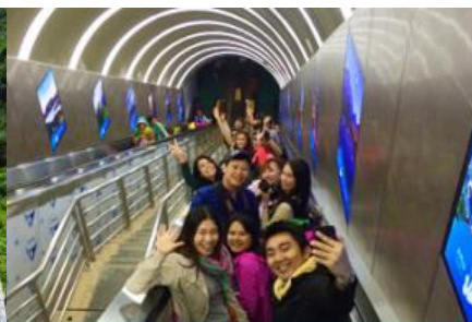
บันไดเลื่อนทะลุภูเขา