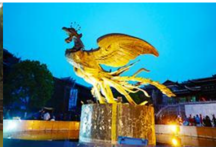
จัตุรัสหงส์