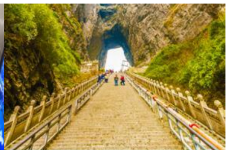
บันได 999 ขั้น