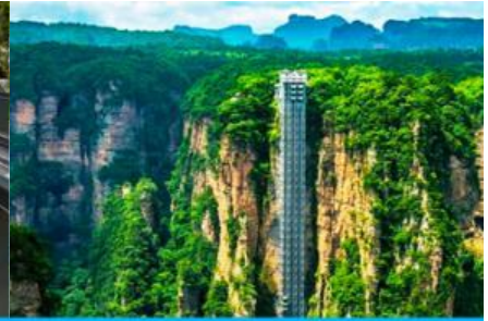
ลิฟท์แก้วอุทยานไ้อ้าย

นำท่านเดินผ่าน ระเบียงกระจกเลียบนหน้าผา ที่มีความสูงจากพื้นล่างถึง 300 เมตร นำท่านเดินผ่าน บันไดเลื่อน จากยอดเขาลงไปยังตัวสะพาน ไ้อ้ายต้าเฉียว 矮寨大桥 ซึ่งเป็นสะพานแขวนข้ามหุบเขาที่เป็นสะพานคร่อมหุบเขาที่ยาวที่สุดในโลก นำท่านโดยสาร ลิฟท์แก้วชมวิว ที่สร้างอยู่ริมหน้าผา และท่านจะได้เห็นความสวยงามอย่างมหัศจรรย์ของธรรมชาติ....เมื่อเสร็จจากการเที่ยวชม จุดท่องเที่ยวต่าง ๆ ในอุทยานแล้ว นำท่านนั่งรถกอล์ฟมายังลานจอดรถ