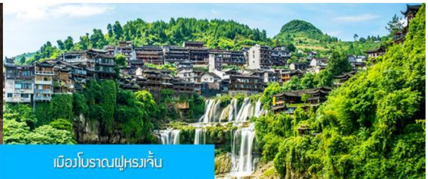
เมืองโบราณฝูหนว้จิ้น

วันที่สาม เมืองจางเจี๋ยเจี้ยน – พิพิธภัณฑ์ภาพเขียนหินทราย- ศูนย์แพทย์แผนจีน – เมืองโบราณฝูหนว้จิ้น