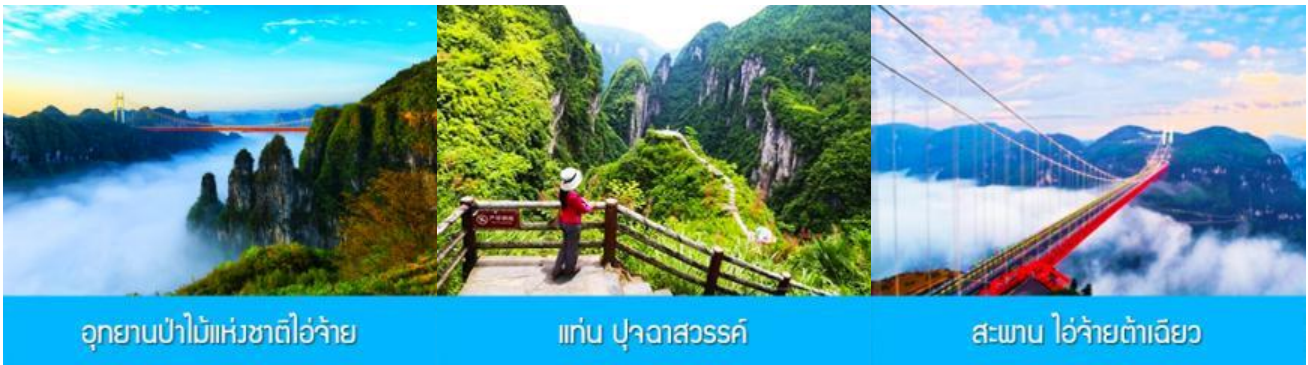
อุทยานป่าไม้แห่งชาติไ่ว่จ้าย

พักที่ โรงแรม CHAXITAI HOLIDAY HOTEL ระดับ 5 ดาวท้องถิ่นหรือเทียบเท่าในย่านฝูหรงเจิ้น