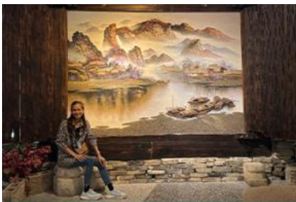
พิพิธภัณฑ์ภาพเขียนหินทราย

พักที่ YICHANG MEIJI BOYUE HOTEL โรงแรมระดับ 4 ดาวหรือเทียบเท่าในเมืองจางเจี๋ยเจี้ยน