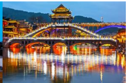
สะพานหงเจียว