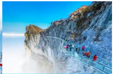
ระเบียงทางเดินกระจกเลียบนหน้าผา