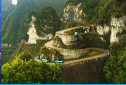
เส้นทาง 99 โค้ง