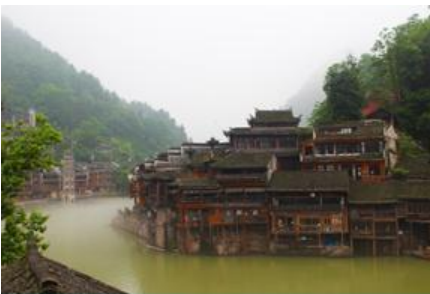
เมืองโบราณฟ่งหวง