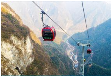
กระเช้าขึ้น/ลงเขาเจ็ดดาว

โรงแรมระดับ 4 ดาวห้องถ้ำหรือเทียบเท่าในเมืองฟงหวง