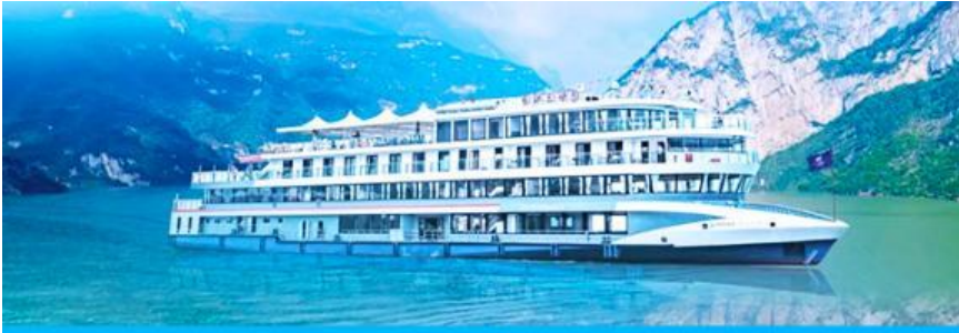
ล่องเรือชมเขื่อนสามผา

e-mail: tour.aaj@gmail.com, Website: www.allabout-journey.com