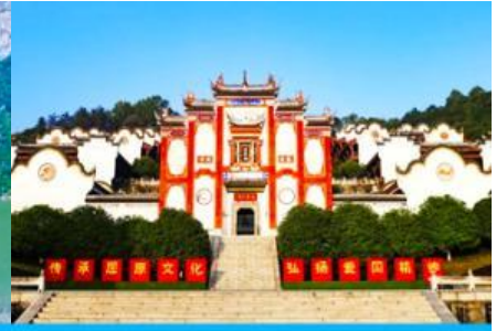
บ้านเกิดกวี ขวี่หยวน

วันที่สอง ล่องเรือชมเขื่อนสามผา – บ้านเกิดกวี ขวี่หยวน –สวนถ้ำสามสหาย -เมืองจางเจียเจี๋ย