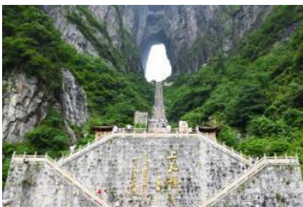
ประตูสวรรค์