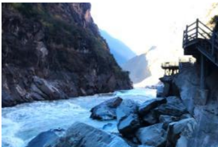
ช่องแคบเสือกระโจน

พักที่ DEQING HOTEL ระดับ 4 ดาวห้องถื่นหรือเทียบเท่าในเมืองเต๋อซิ่น