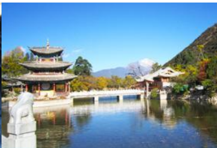
สระน้ำมังกรดำ