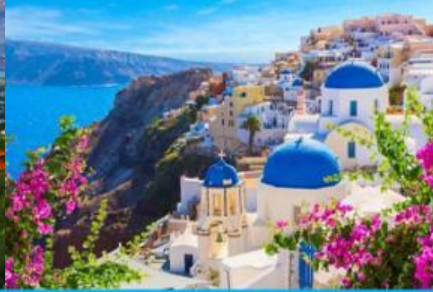
ย่านซานโตรินี่