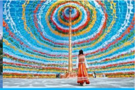
ซุ้มพ้ายันต์หลากสี

วันที่สอง เมืองต้าหลี่ – เจดีย์สามองค์ – โรงถ่ายหนังแปดเทพอสูรมังกรฟ้า – เดินทางไปแข่งกรील่า – ซุ้มพ้ายันต์ –