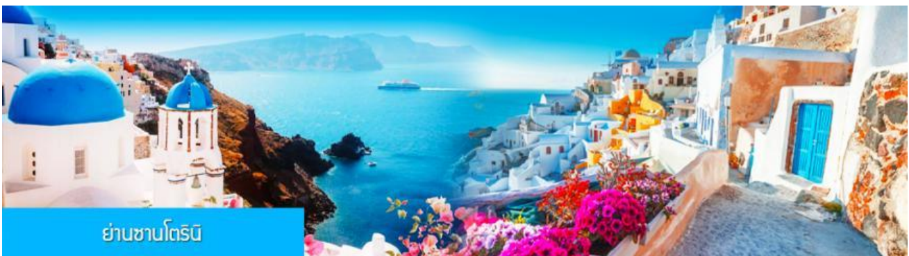
ย่านซานโตรินี่