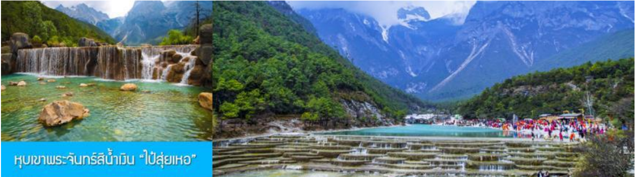
หุบเขาพระจันทร์สีน้ำเงิน “ไป๋ซู่เหอ”

เมื่อคณะโดยสารกระเช้าลงจากภูเขาหิมะมังกรหยก