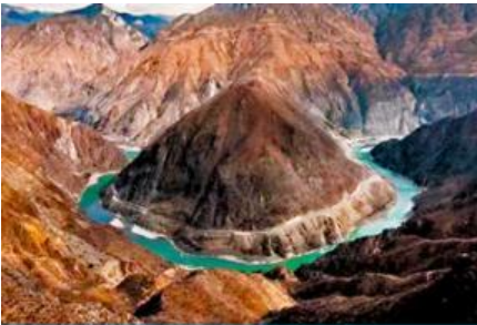
โค้งแรกของแม่น้ำจินซาเคียว

พักที่ PHOENIX HOTEL โรงแรมระดับ 4 ดาวห้องถึง หรือเทียบเท่าในเมืองแซงกริล่า