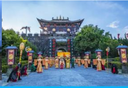
โรงถ่ายทำภาพยนตร์ แปดเทพอสูรมังกรฟ้า