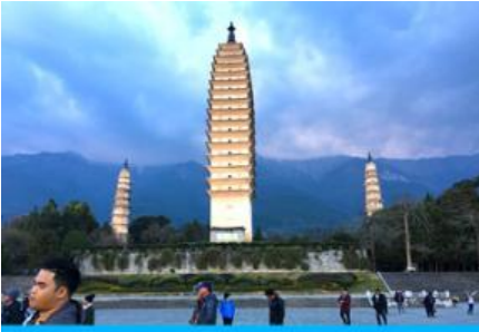
เจดีย์สามองค์

e-mail: tour.aaj@gmail.com, Website: www.allabout-journey.com