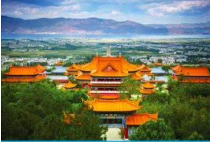
เมืองต้าหลี่

e-mail: tour.aaj@gmail.com, Website: www.allabout-journey.com