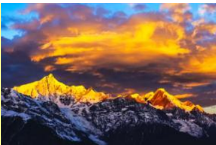
ภูเขาหิมะเหมยหลี่

หลังอาหารนำท่านเข้าสู่โรงแรมที่พักในเมืองเต๋อซิ่น ให้ท่านพักผ่อนหรือเดินเล่นถ่ายภาพในเมืองตามอัธยาศัย