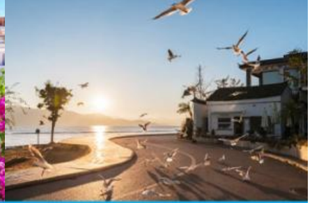
ย่านชวยหารูป S

วันแรก ต้าหลี่ ท่าอากาศยานสุวรรณภูมิ – เมืองต้าหลี่ – ย่านซานโตรินี่ – ย่านชวยหารูป S -เมืองโบราณ