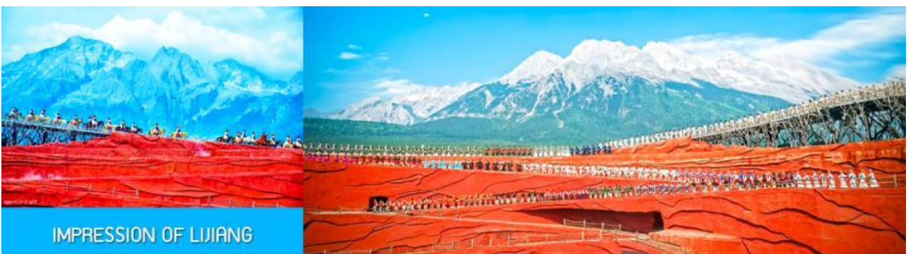
IMPRESSION OF LIJIANG

เมื่อคณะโดยสารกระเช้าลงจากภูเขาหิมะมังกรหยก นำท่านขึ้นรถบัสสู่เมืองลี่เจียง