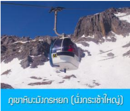
ภูเขาหิมะมังกรหยก (น้ิงกระเซ้าใหญ่)

พักที่ LIJIANG FENGHUANG HOTEL ระดับ 4 ดาวท้องถิ่นหรือเทียบเท่าในเมืองลี่เจียง