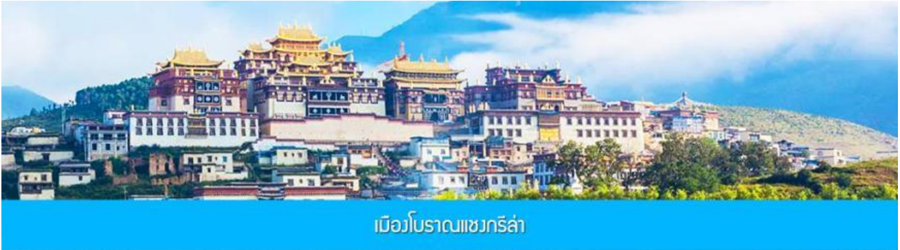
เมืองโบราณแซงกริล่า

e-mail: tour.aaj@gmail.com, Website: www.allabout-journey.com