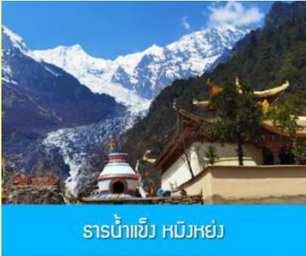
ธารน้ำแข็ง หับห่วย

e-mail: tour.aaj@gmail.com, Website: www.allabout-journey.com