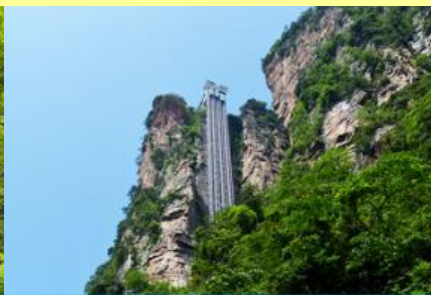
ลิฟท์แก้วไปหลง