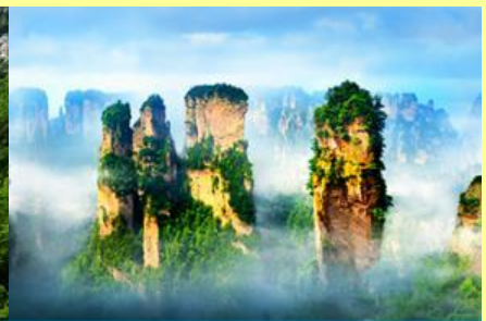
ภูเขาอวดาร

โปรแกรมเสริมที่ 2 โปรแกรมเที่ยวชมอุทยานภูเขาอวดารแบบครึ่งวันที่รวมค่าขึ้นลิฟท์แก้ว (ผู้เข้าร่วมขั้นต่ำ 15 ท่าน) ใช้เวลาประมาณ 4-6 ชั่วโมง (ขึ้นอยู่กับจำนวนนักท่องเที่ยวในแต่ละวัน) อัตราค่าบริการท่านละ 750 หยวนหรือ 3,750 บาท นำท่านเที่ยวชมจุดชมวิวล่าธารจีนเปียนซีที่สามารถมองเห็นวิวยอดเขาอวดารได้ชัดเจน นำท่านเที่ยวชมจุดชมวิวจินเปียนซีที่สามารถมองเห็นทัศนียภาพของภูเขาอวดารและลิฟท์แก้วได้ชัดเจน นำท่านขึ้นลิฟท์แก้วขึ้นสู่ยอดเขาอวดาร นำท่านเดินชมจุดชมวิวด่าง ๆ บนยอดเขาอวดาร ได้แก่ภูเขาฮาเลลูยา สะพานหนึ่งในใต้หล้า... อัตราค่าบริการรวม ค่าบัตรเข้าอุทยาน ค่ารถรับส่งภายในเขตอุทยาน ค่าน้ำเที่ยวของไกด์ท้องถิ่น