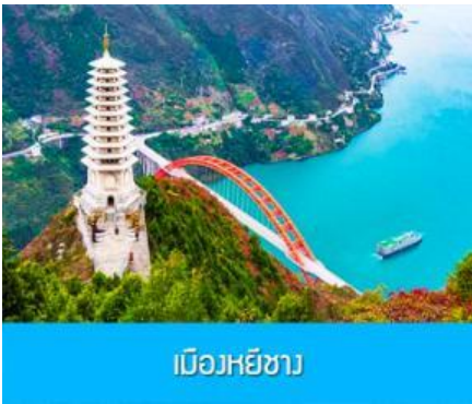
เมืองหยีซาง