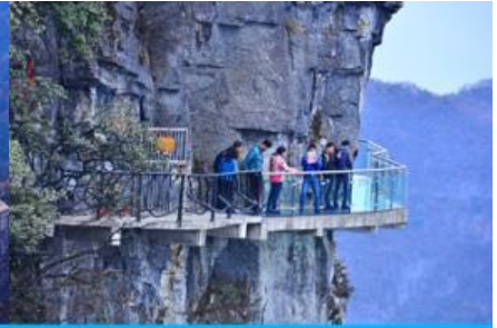
หน้าพาลอยฟ้ากามเดินกระจก