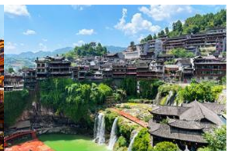
เมืองโบราณฟูหรงเจิน

วันที่สาม เมืองจางเจี๋ยเจี๋ย-ศูนย์จำหน่ายผลิตภัณฑ์ยาวพารา-ตึกมหัศจรรย์ 72 ชั้น-เมืองโบราณฟูหรงเจิน เย็นยามค่ำคืน