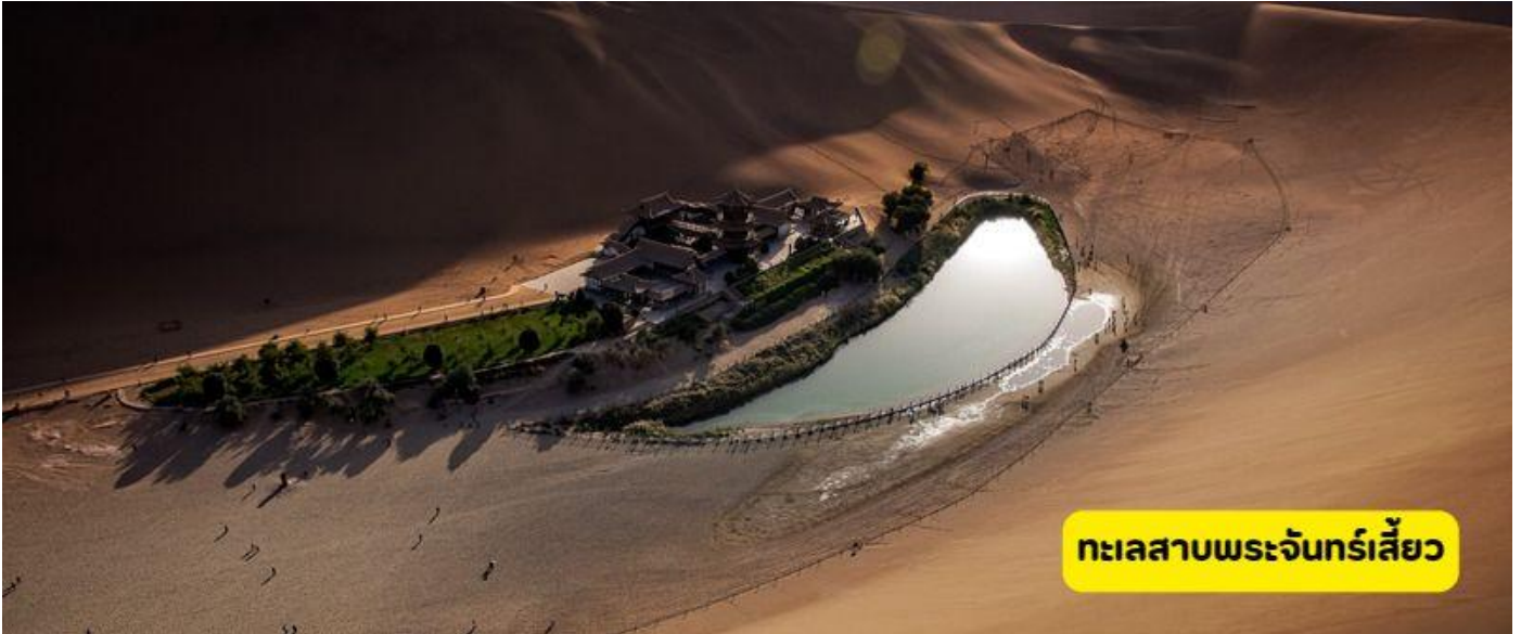
ทะเลสาบพระจันทร์เสี้ยว

เมืองเจียอี้กวน - เมือง둔หวง - ทะเลทรายหมิงซาซาน(รวมซีลู่)- ทะเลสาบพระจันทร์เสี้ยว