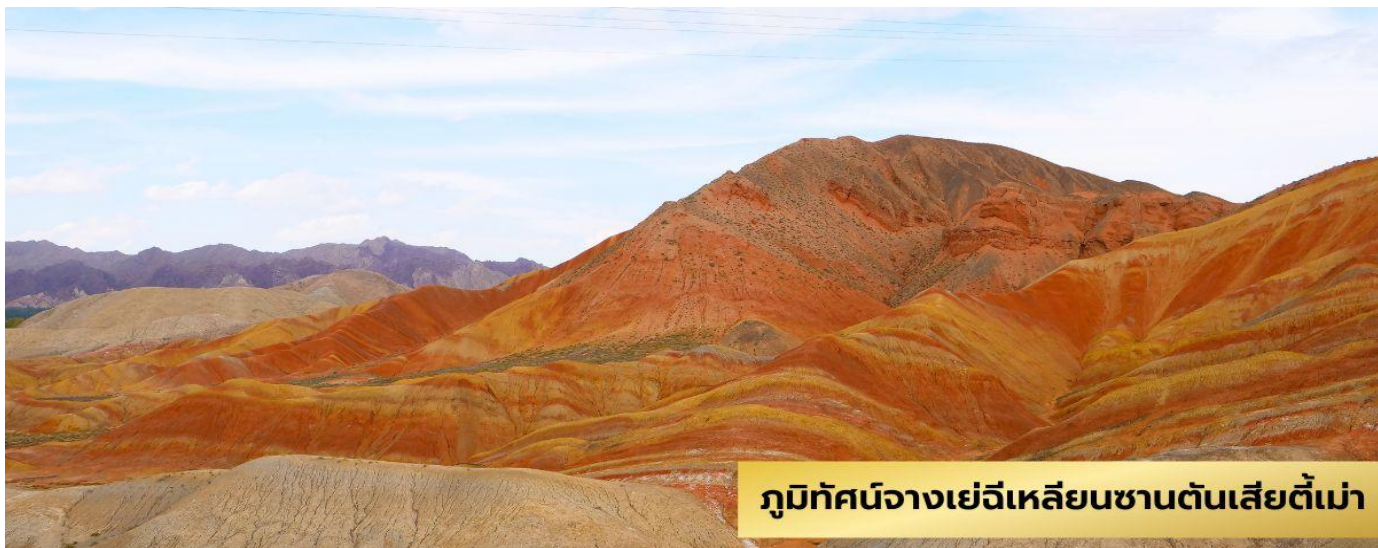
ภูมิทัศน์จางเย่จีวเหลียนซานตันเสียดี้เมา

วันที่สาม เมืองอูเหว่ย - เมืองจางเย่ - หุบเขาสายรุ้ง - เมืองจีวเจี๋ยน - สวนจีวฉวนสมัยราชวงศ์ฮั่น ตะวันตก