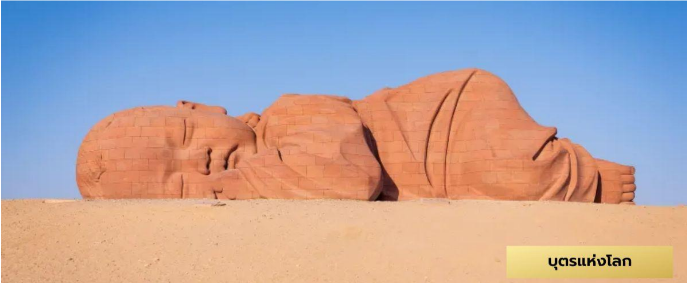
บุตรแห่งโลก

เมืองกวาโจว – บุตรแห่งโลก - ทะเลทรายหมิงซาซาน(รวมซีอูลู)-ทะเลสาบพระจันทร์เสี้ยว